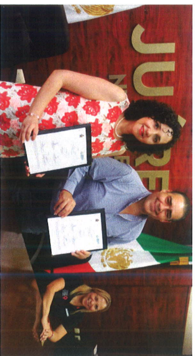
El alcalde de Juárez, Heriberto Treviño Cantú busca fortalecer el respeto a los derechos humanos.

Con lo anterior se busca fortalecer el respeto efectivo de los derechos humanos, impulsando la cultura de la legalidad, brindando las herramientas necesarias para que todas las personas que trabajen en el servicio público respondan a las necesidades de la población.